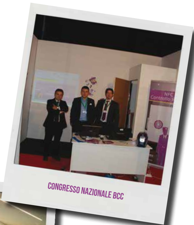
CONGRESSO NAZIONALE BCC