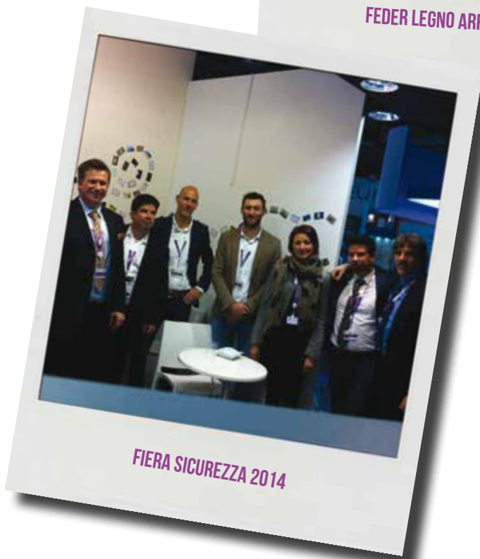
FIERA SICUREZZA 2014