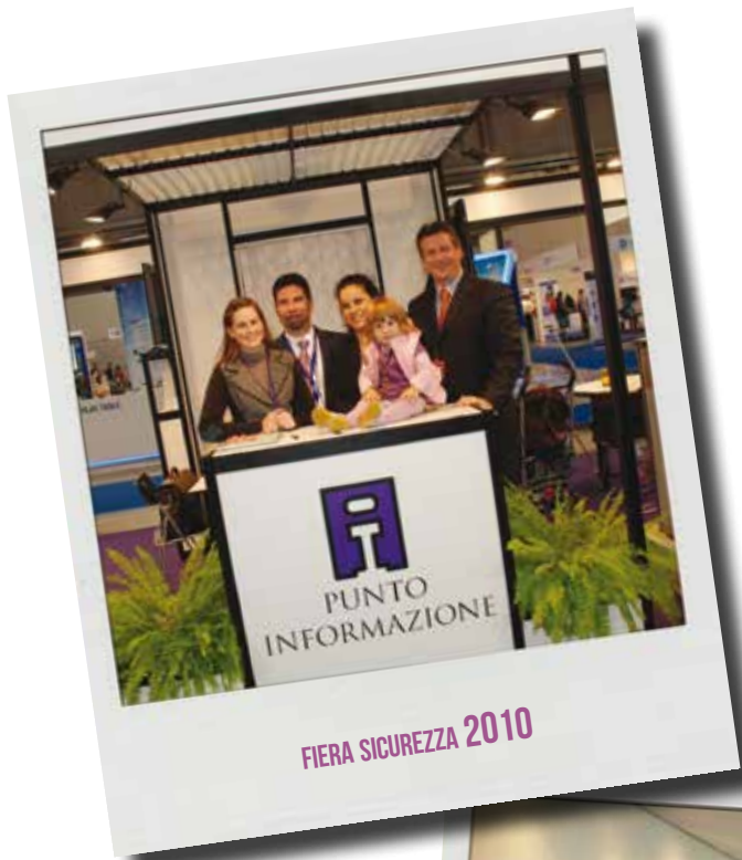
FIERA SICUREZZA 2010