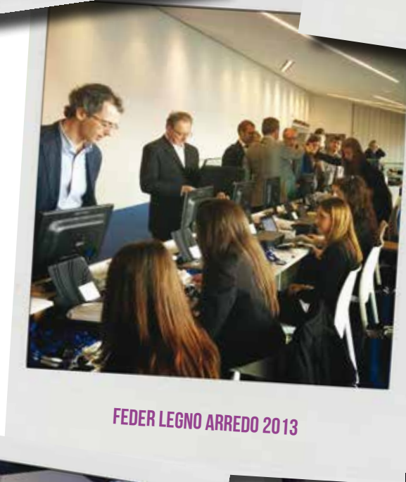
FEDER LEGNO ARREDO 2013