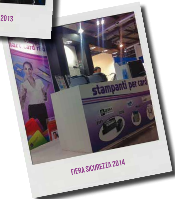
FIERA SICUREZZA 2014